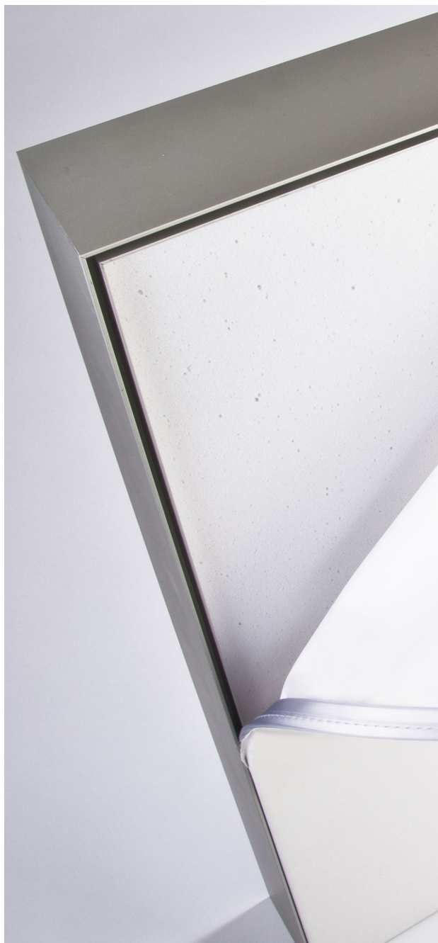
Alurahmen mit umlaufender Nut zur Aufnahme des Wechselketers. Offenzelliger Breitbandabsorber, Spanntuch mit angenähertem PVC-Keder.

Web: office-akustik.com – hamburgfotos.de