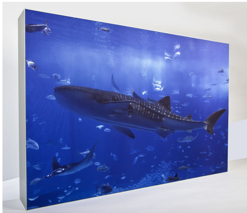
Akustikbild mit brillanten Textildruck nach Kundenmotiv.

Einzelwert \alpha_w nach DIN EN ISO 11654 => 1,00